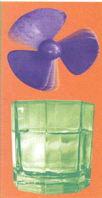
el aire y el agua