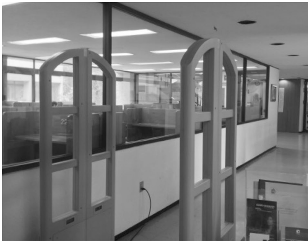
Entrada de la Biblioteca Eduardo García Máynez

El organigrama de la Biblioteca comprende una Coordinación y cuatro secciones: Desarrollo de Colecciones y de Cómputo, Colecciones Especiales, Hemeroteca y Bibliografía Filosófica Mexicana y Archivos.