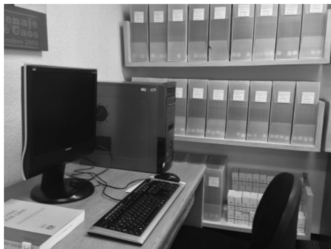
Área de Archivos

A partir de 1997 se han recibido diversos documentos, a los que independientemente de su procedencia se les ha concentrado en la Serie CUATRO , que se forma de 13 carpetas. También, en el año 2000 la Biblioteca Nacional de México fumigó las cuatro series. En 2006 en el Fondo Gaos se realizó la conversión de la base Gaos en ISIS al programa Aleph.