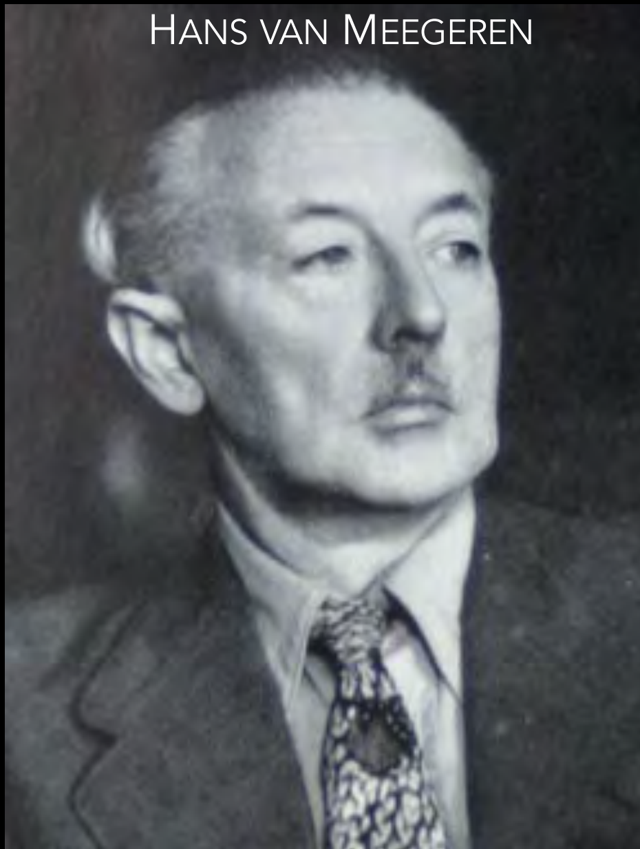
HANS VAN MEEGEREN