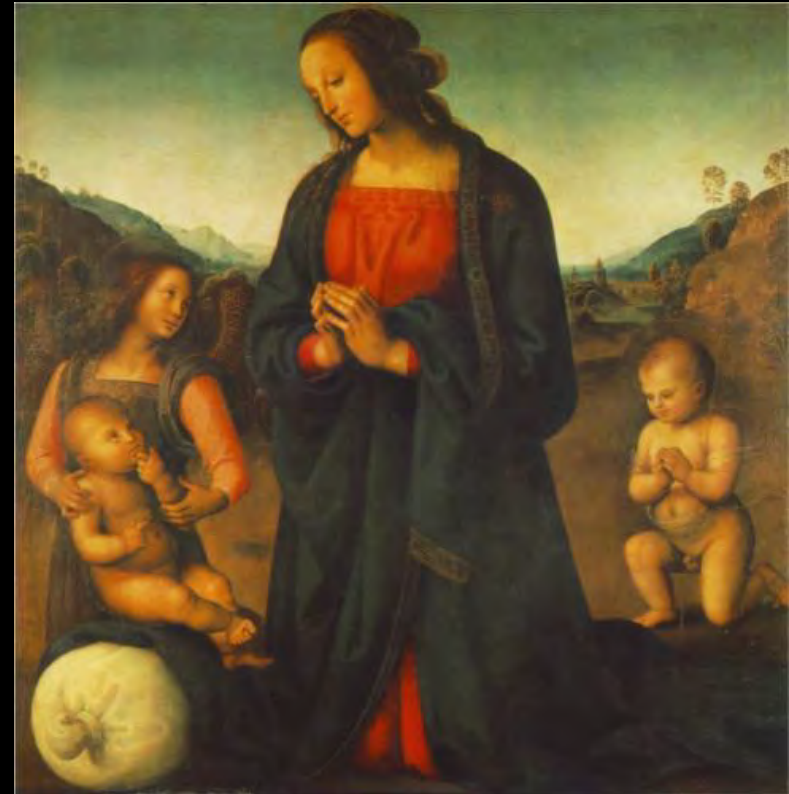
Perugino: Madonna, ángel y el pequeño L San Juan adorando al niño , 1497