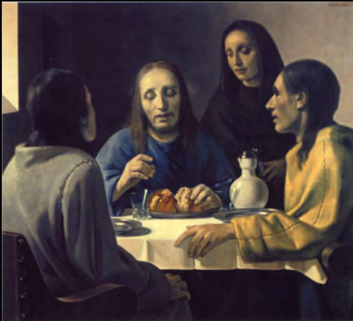
LA CENA DE EMAÚS