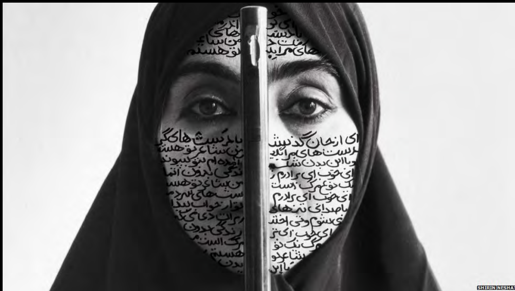
Shirin Neshat "Mujeres de Alá (serie)" (1993-97)