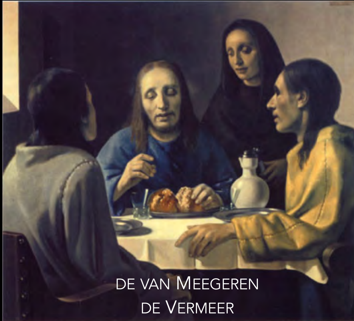
DE VAN MEEGEREN DE VERMEER