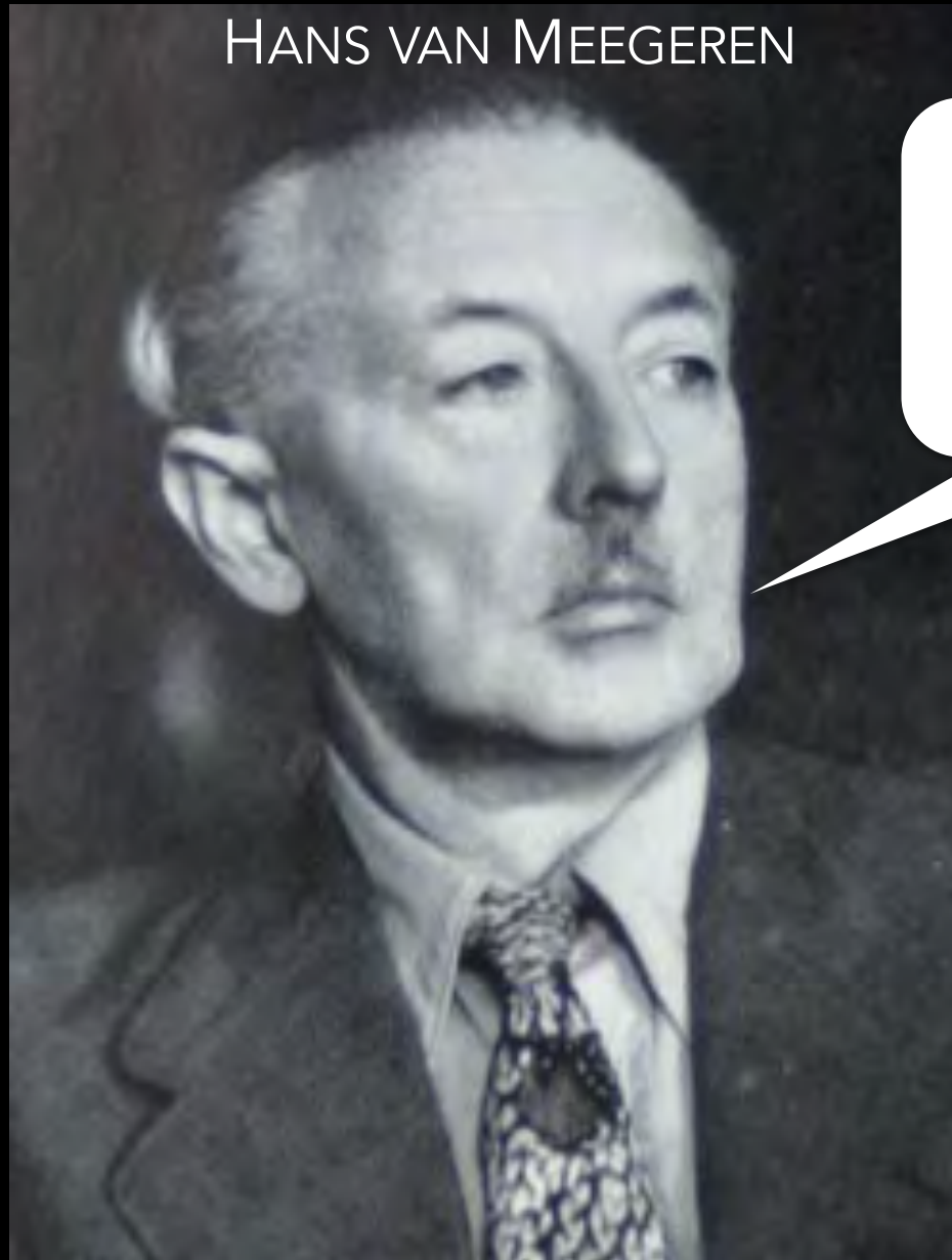
HANS VAN MEEGEREN