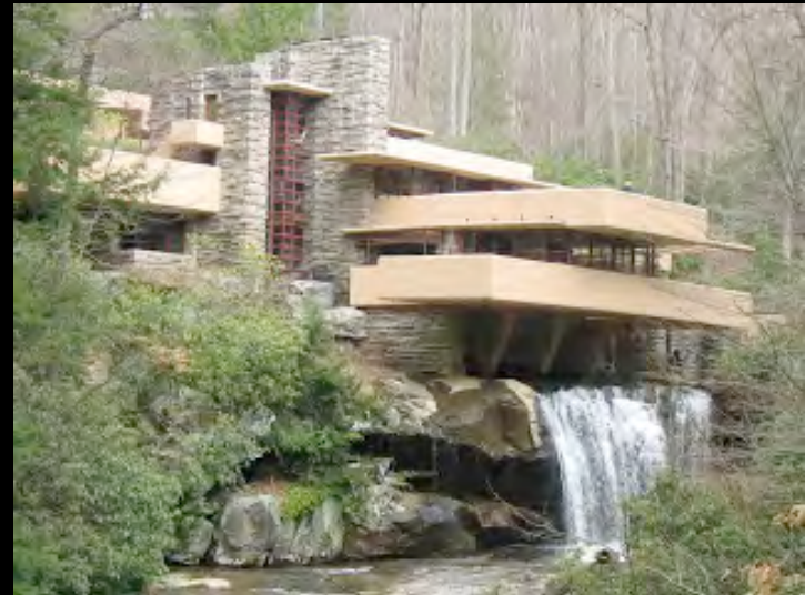
Fallingwater House de Lloyd Wright