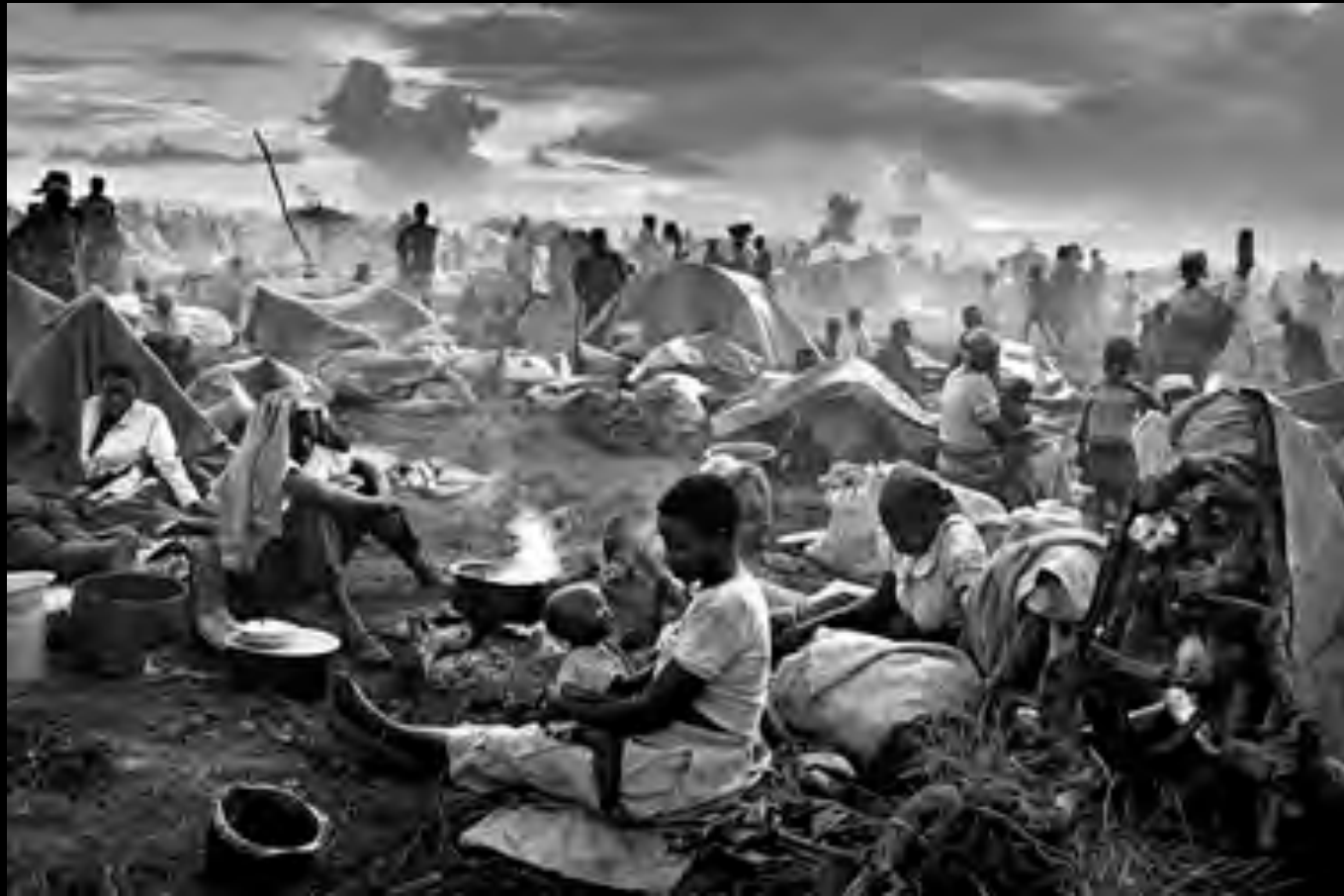
Sebastiao Salgado "Refugiados Ruandeses" (1994)