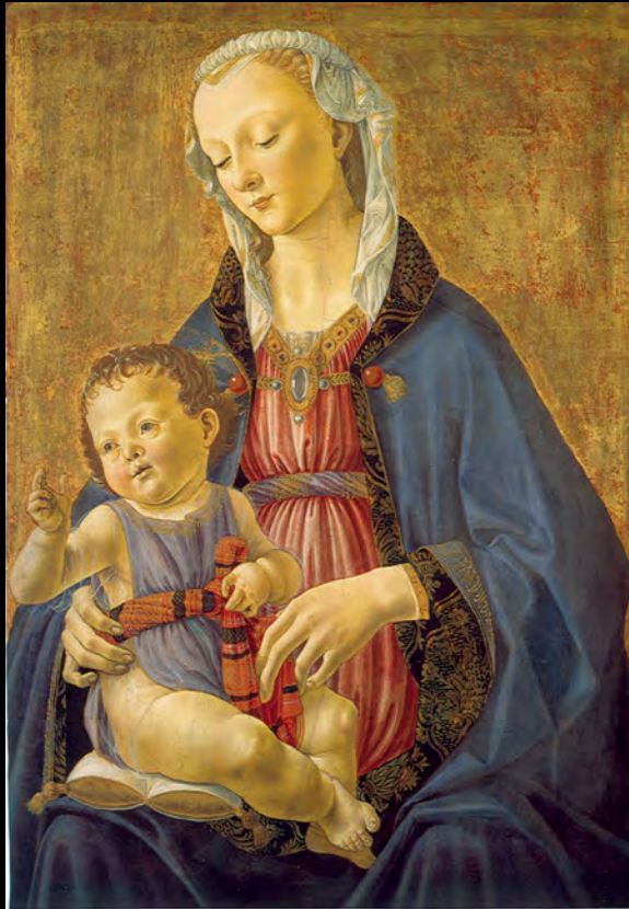
Ghirlandaio, Madonna 1449