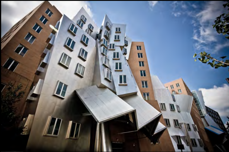
MIT Stata Center, Frank Gehry